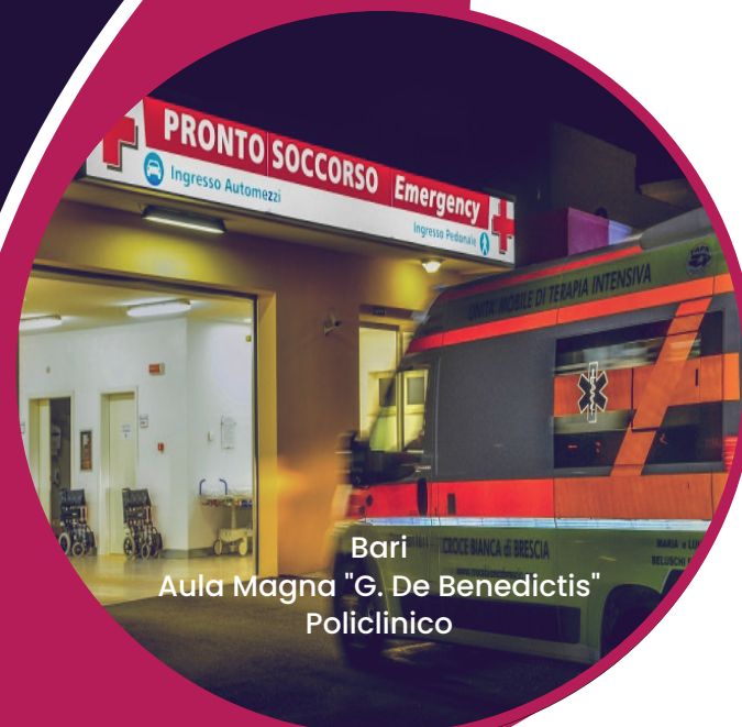
Bari Aula Magna "G. De Benedictis" Policlinico