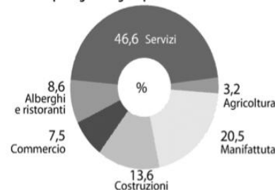
Il pil degli immigrati per settore di attività